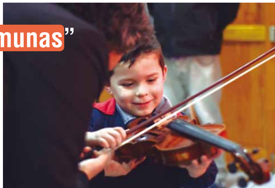
Antes de la pandemia, el TRM ofreció talleres artísticos para niños y jóvenes de diversas y apartadas localidades de la comuna de Romeral.

“Cuando estalló la pandemia, debido a que no se podía tener presencialidad, fue más difícil poder trabajar con el TRM de manera directa, así que nos incorporamos con ellos en el proyecto AMA y comenza-