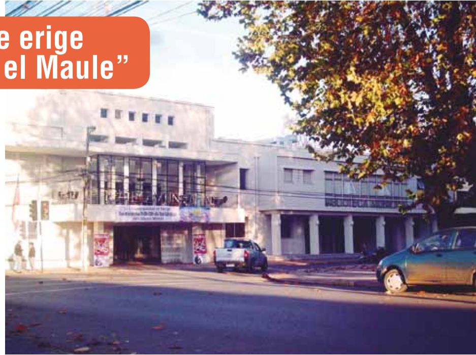
El Teatro Municipal de Parral ha recibido constante apoyo del TRM para enriquecer su programación de actividades.

Luego destaca: “Son muchas las razones para que Parral se vincule a este nuevo aniversario del Teatro Regional del Maule, deseándole muchos éxitos en esta nueva etapa en que abren las puertas a la programación cultural con público presencial. A la vez, valorar el inmenso apoyo recibido, que ha ido creciendo durante estos años y gracias al cual, hoy nuestra comuna se erige como un importante destino cultural en el Maule”.