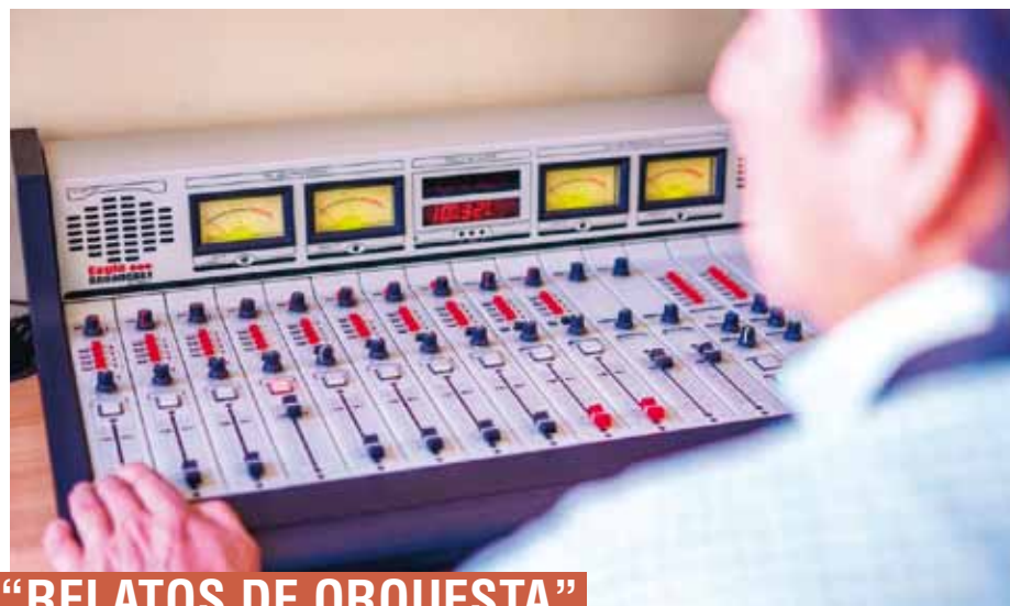
“RELATOS DE ORQUESTA”